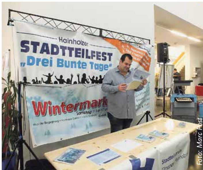
Stadtteilverein beim Markt der Möglichkeiten in der KGSE (März 2018)