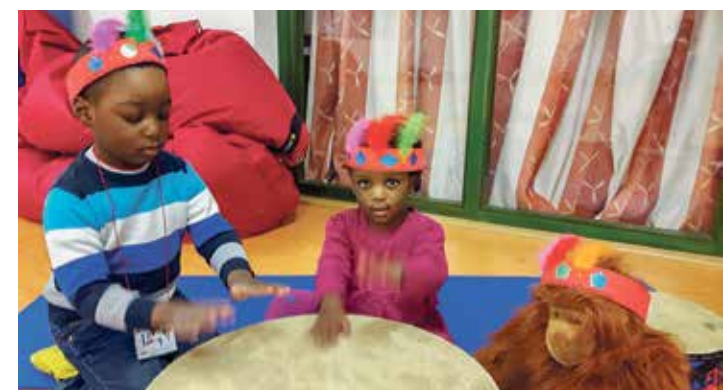
Beim Stadtteilfonds-Projekt „Kling Klong – Die musikalische Früherziehung“ sind noch Plätze frei!

PS: An all diejenigen, die uns Anfang März bis Mitte Juni telefonisch nicht erreichen konnten: Die Nummer funktioniert wieder :-)