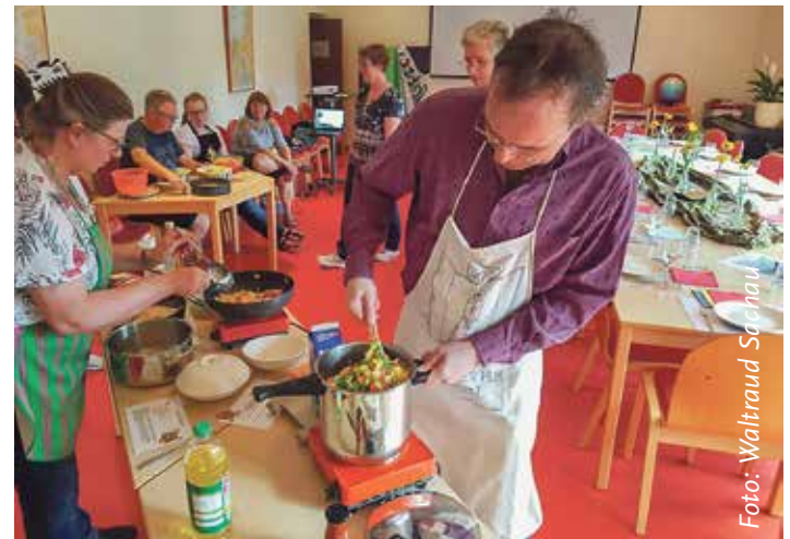
Hier entsteht die Füllung viele leckere Samosa – ein traditionelles Gericht aus Ruanda und Uganda