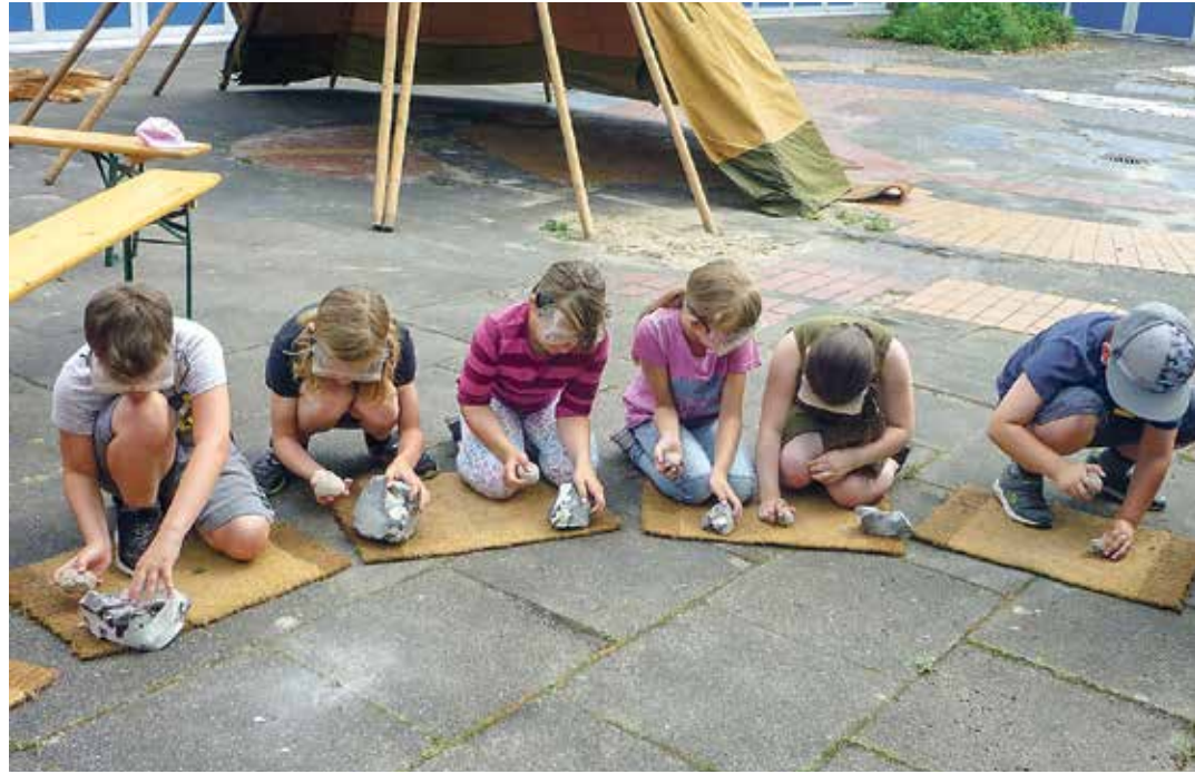
Nicht ganz wie in der Steinzeit: Mit Schutzbrillen machen sich die Kinder auch gut als Marsmännchen!

den Utensilien. Was das wohl werden soll? Holger blies das Büffelhorn und los ging's. Nach kurzer Kennenlernrunde und theoretischer Einführung war die Stimmung gelöst und das Vertrauen in den Steinzeitmann da.