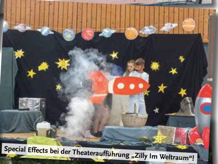
Special Effects bei der Theateraufführung „Zilly Im Weltraum“!