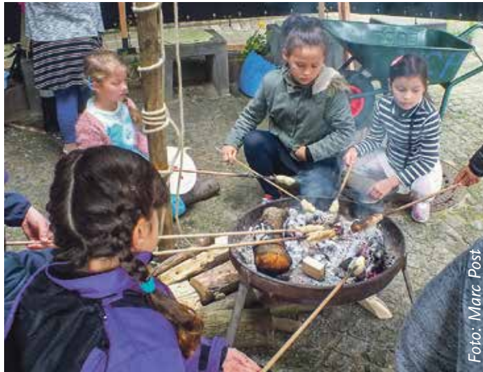
Jurte und Stockbrot – beim Hainholzer Stadtteilfest am 1. September 2018 ist der Pfadfinder Stamm Aver Liekers vom VCP Elmshorn natürlich wie immer am Start!