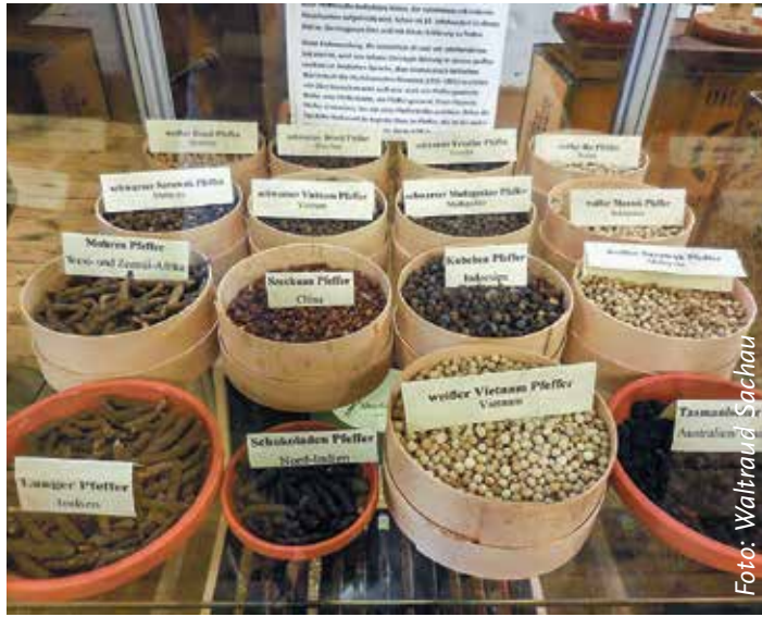
Alleherhand Pfeffer gab es im Gewürzmuseum in der Hamburger Speicherstadt zu entdecken!

Beim Besuch im Gewürzmuseum lernten wir etwas über die vielfältigen und exotischen Gewürze auf der weiten Welt. Der zweite aus-