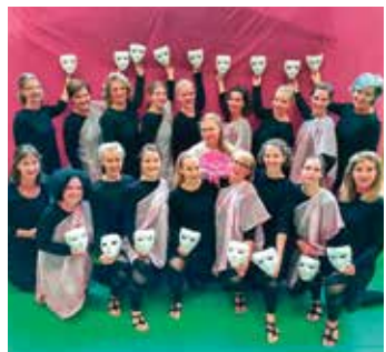
Die Jazz-Dancer TaMiLe vom FTSV Fortuna Elmshorn